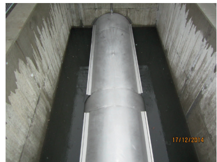
Bild: Absperrschieber bei Montage